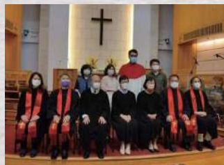
感恩成為望覺堂執事 同心事奉教會