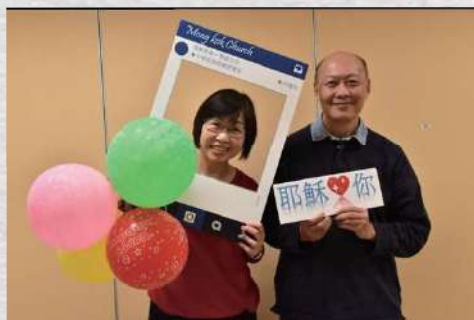
夫妻二人，共建主愛滿溢的家庭

90年代結婚後，接受了許開明牧師的邀請和加入了雅歌團契至今，團友一起成長，互相分享養育兒女及健康心得，雅歌團契近年更加入不少的團友，廣結果子，讓基督的愛與更多弟兄姊妹分享。