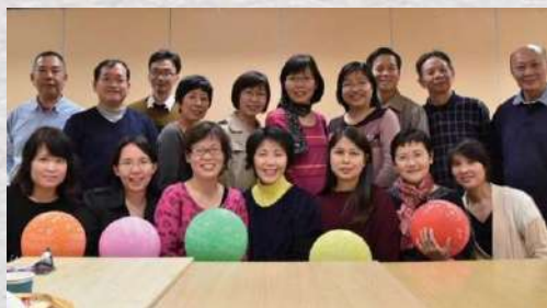
雅歌團契同心建立 · 愛心團契 · 服侍教會

近幾年退休後亦參加了週二探訪教友及晚上的祈禱會。大家一同透過向上主禱告，關心社會，教會的事工及肢體，實踐分享主愛。