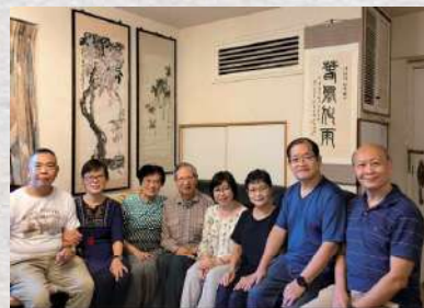
夫婦兩人參與教會探訪部事奉